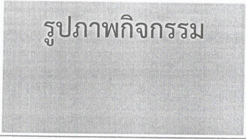
ภาพที่ 2 : (บรรยาย).....