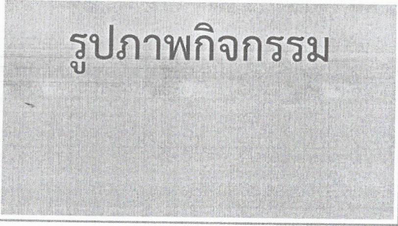
ภาพที่ 1 : (บรรยาย).....